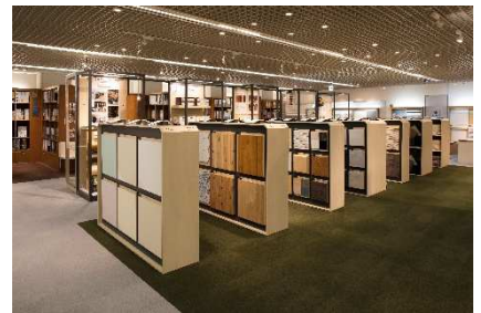
CLUB OZONE スクエア カatalogライブラリー

https://www.ozone.co.jp/space/clubozone_square/