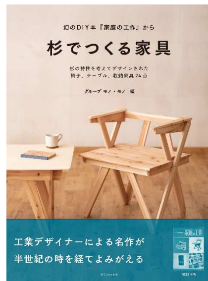
書籍『杉でつくる家具』（グラフィック社刊）

こどもの日に因んで、売るのも買うのも子どもが行う「MOTTAINAI キッズフリーマーケット」を開催します。