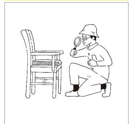
イラスト：若村大樹