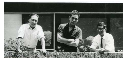
KAKデザイングループ