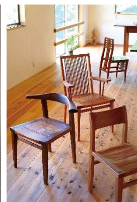
京都炭山朝倉木工