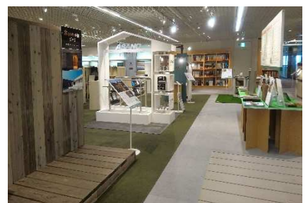
昨年開催の展示「エクステリア大辞典」会場より

製品の实物やサンプルを展示するほか、エクステリア計画のポイントや、外まわり製品の選び方を幅広い視点から解説します。会期中にプロユーザーに向けた運動セミナーを開催します。